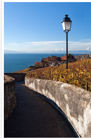
Invitație... la orice!