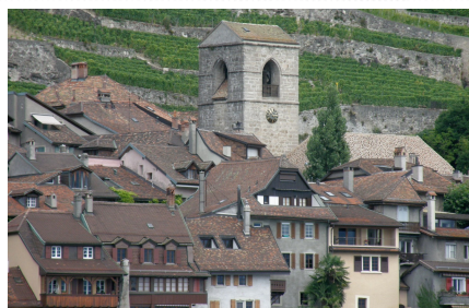
Regiunea Lavaux este patrimoniul UNESCO.