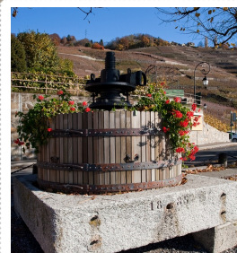
Grija pentru detalii este copleșitoare

"The power of the river is to flow wildly! The power of the lake is to think calmly! Wise man both flows like a river and thinks lake a lake!" - Mehmet Murat Ildan