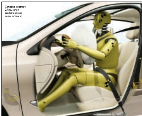
Compania investeste 25 mil. euro în producția de saci pentru airbag-uri

Takata-Petri este unul dintre cei mai importanți producători mondiali de volane, centuri de siguranță, airbag-uri, scaune auto pentru copii și sisteme electronice de siguranță pentru industria auto, principalii clienți fiind DanimexChrysler, BMW, VW,