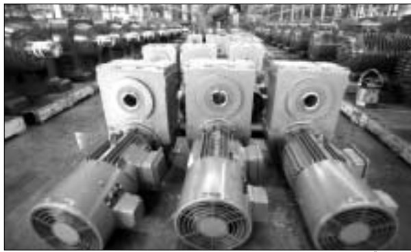
Investițiile în echipamente și tehnologii au contribuit cel mai mult la creșterea economică a SUA

„Piața muncii rămâne în continuare slabă, conform unui raport al Ministerului Muncii din SUA, numărul persoanelor care