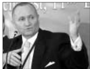
Petru Rares crede că salariile în sectorul bancar vor continua să crească

Instituțiile de credit își vor diversifica oferta, vor intra pe terete segmentele de piață și se vor orienta din ce în ce mai mult către localitățile mici, intrucât în marile centre urbane sectorul de profil va fi suprasaturat, au mai arătat participanții la discuții.