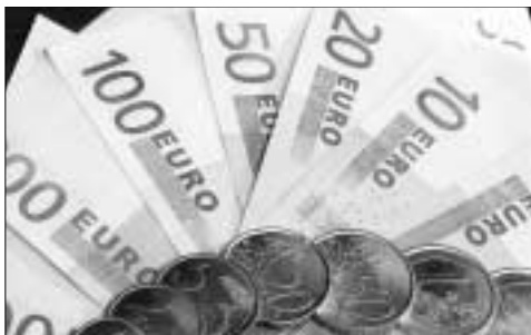
Guvernatorul BNR estimează că în bănci nu au intrat capitaluri volatile mai mari de 1,2 mld. euro

O parte din bani au fost reinvestiți în sectorul imobiliar, în timp ce o parte din plasamente în lei au fost reinvestite, iar anumite sume au fost retrase mai ales după decizia BNR de a menține