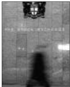
Dacă London Stock Exchange va fuziona cu NASDAQ va rezulta prima burse transatlantice

BURSA din Londra (LSE), asupra căreia se exercită presiuni pentru a fi de acord cu preluarea de către operatorul american NASDAQ, a raportat o creștere sub așteptări a profitului pe semestrul al doilea, în contextul creșterii volumului de tranzacționare și a numărului de oferte de acțiuni, relatează Bloomberg.