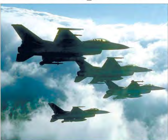
Aeronave americane de atac au făcut de astăzi data celeritate

„La cel mai mic semn de nesupunere, suntem gata să lovim” Tony Blair