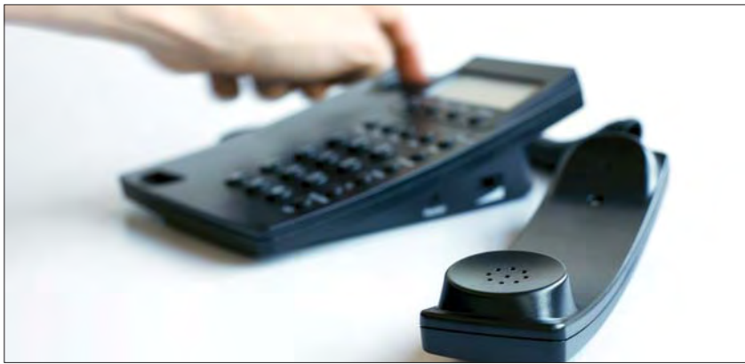
Grupul elen OTE a preluat controlul operatorului național de telefonie fixă Romtelecom după aproape cinci ani