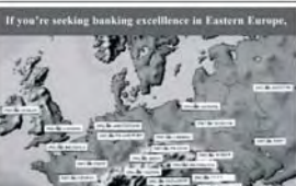
If you're seeking banking excellence in Eastern Europe, we're there.