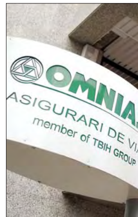
Aceasta a fost cea mai mare tranzacție de pe piața asigurărilor din România până la acel moment

Cea mai mare tranzacție de pe piața asigurărilor din România de până atunci a fost semnată la Tel Aviv: 64 de milioane de euro pentru 70,7% din acțiunile Omniasig, deținute de fondul de investiții israelian TBH Financial Service Group.