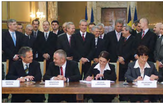
Semnarea contractului pentru privatizarea BCR a închis istoria falimentului Bancorex

suma încasată de statul român din privatizarea BCR în cea mai mare afacere pe care a reușit să o facă în 15 ani de capitalism, când a privatizat cele mai importante active aflate în proprietatea sa.