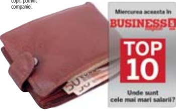
Unde sunt cele mai mari salarii?